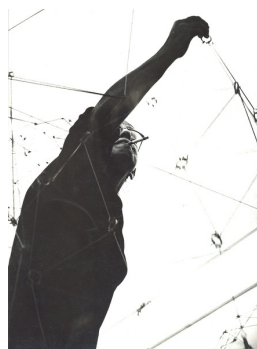
AUTOR IMAGEN: JUAN SANTANA. © FUNDACIÓN GEGO