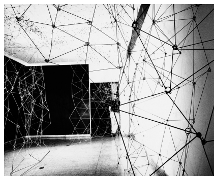
AUTOR IMAGEN: JUAN SANTANA. © FUNDACIÓN GEGO