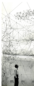
AUTOR IMAGEN: PAOLO GASPARINI. © FUNDACIÓN GEGO