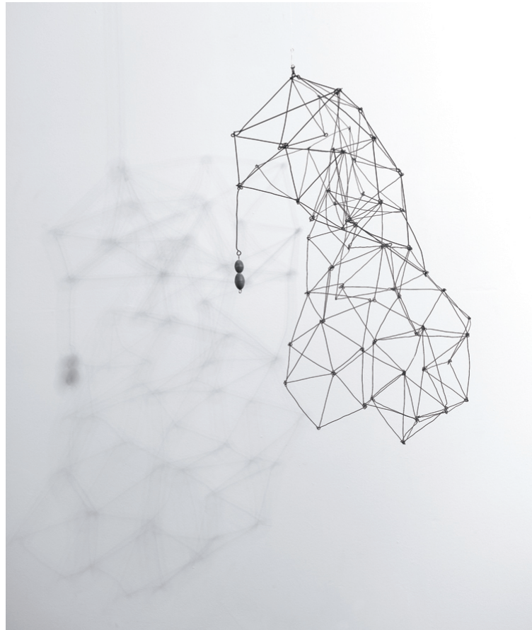
AUTOR IMAGEN: ORIOL TARRIDAS. © FUNDACIÓN GEGO