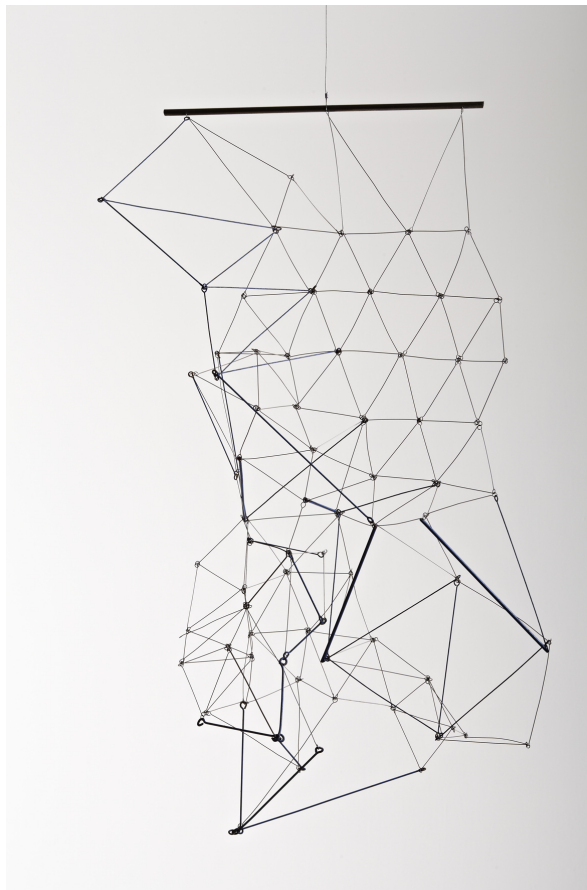
AUTOR IMAGEN: KEN HOWIE. © FUNDACIÓN GEGO / © KEN HOWIE STUDIOS