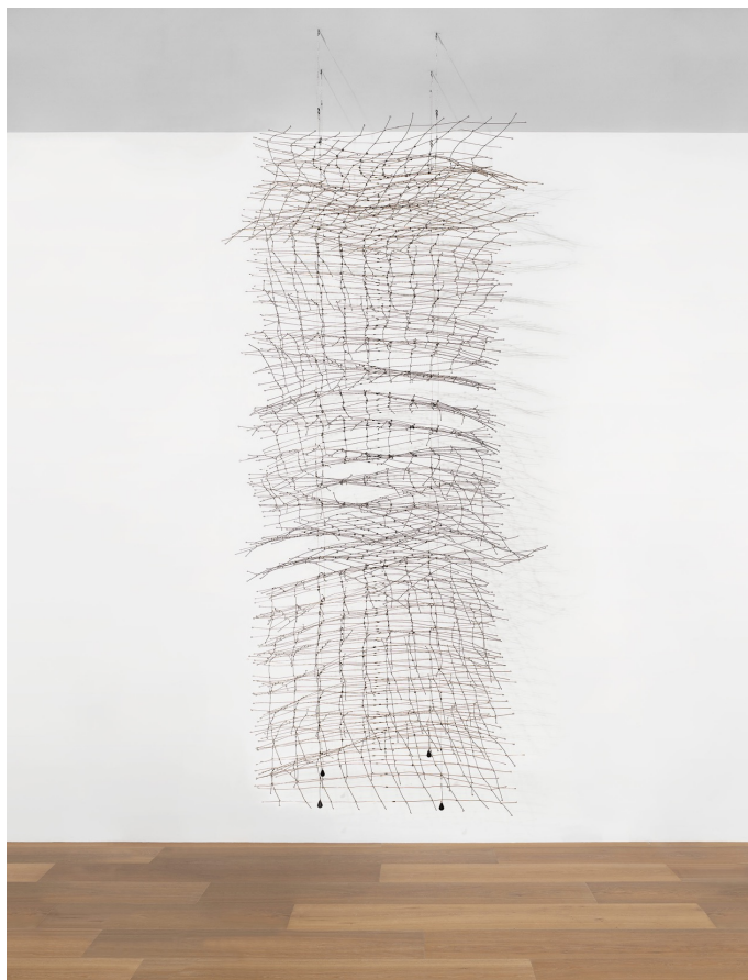
AUTOR IMAGEN: MATTHEW HOLLOW. © FUNDACIÓN GEGO / © LÉVY GORVY GALLERY