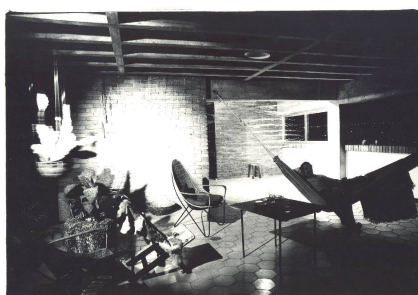
AUTOR IMAGEN: CLAUDIO PERNA. © FUNDACIÓN GEGO / © FUNDACIÓN CLAUDIO PERNA