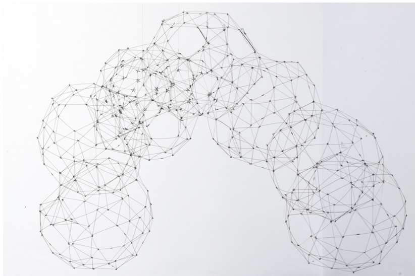
AUTOR IMAGEN: JERRY HARDMAN-JONES. © FUNDACIÓN GEGO / © HENRY MOORE INSTITUTE