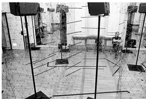
AUTOR IMAGEN: PETER HÖNIG. © FUNDACIÓN GEGO