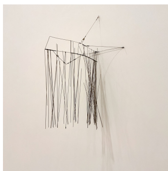
AUTOR IMAGEN: ESTER Crespín. © FUNDACIÓN GEGO