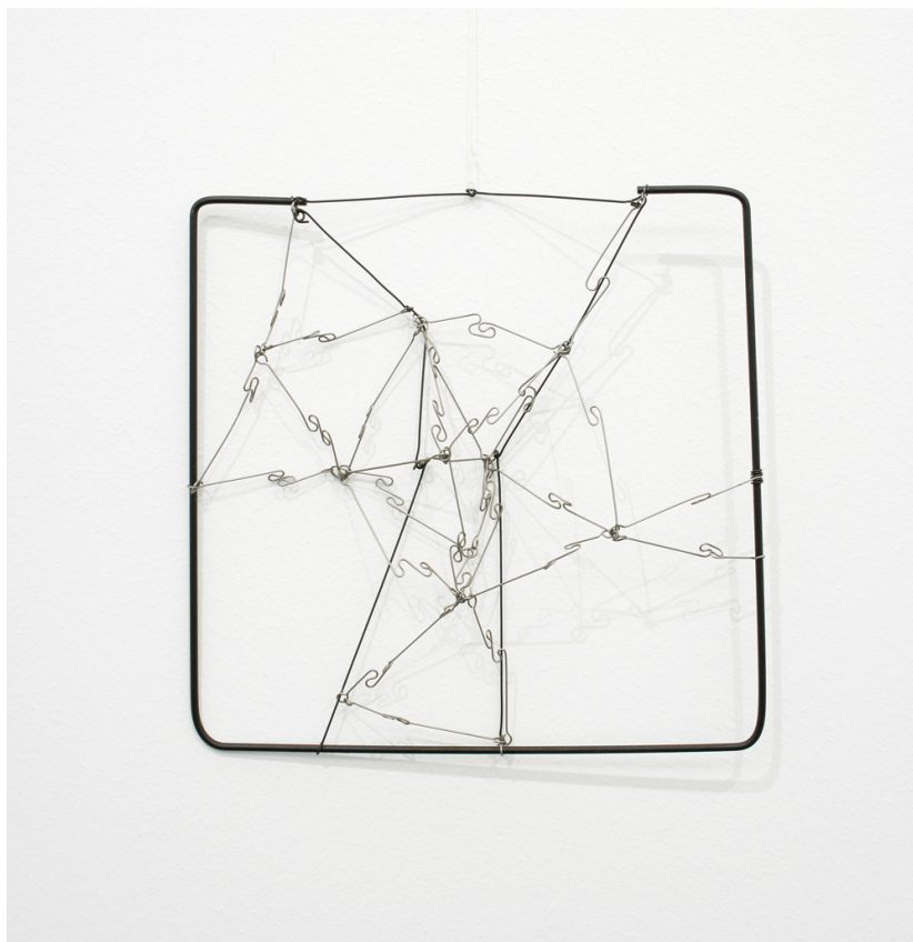
AUTOR IMAGEN: DESCONOCIDO. © FUNDACIÓN GEGO / CORTESÍA MACBA