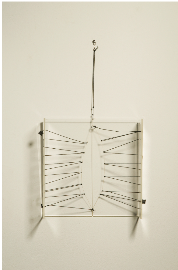
AUTOR IMAGEN: CLAUDIA GARCÉS. © FUNDACIÓN GEGO