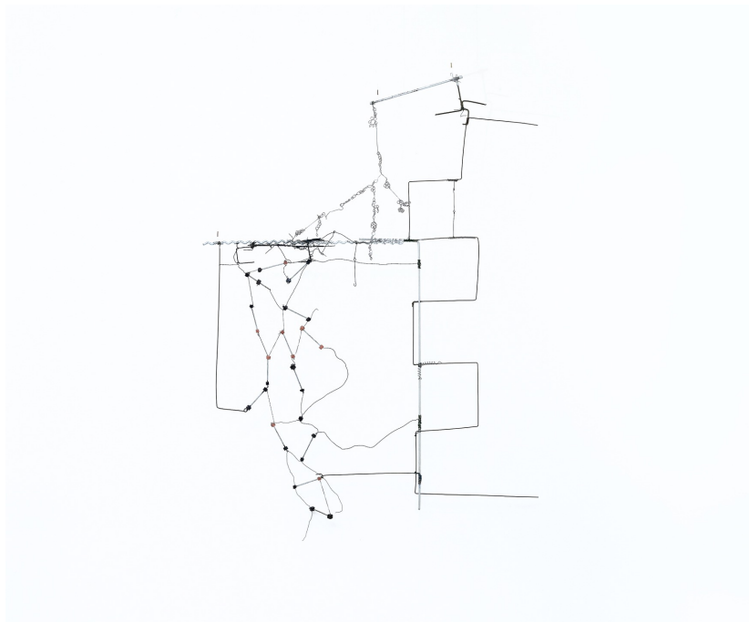
AUTOR IMAGEN: EDUARDO FERMIN. © FUNDACIÓN GEGO