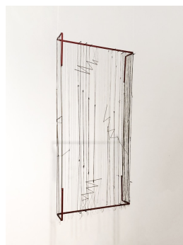
AUTOR IMAGEN: MANUEL EDUARDO GONZÁLEZ. © FUNDACIÓN GEGO