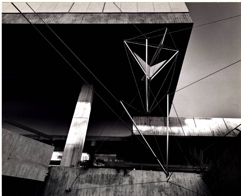
AUTOR IMAGEN: PAOLO GASPARINI. © FUNDACIÓN GEGO