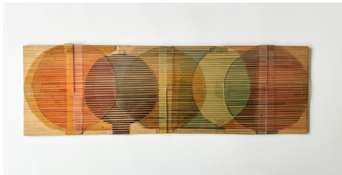
AUTOR IMAGEN: MANUEL EDUARDO GONZÁLEZ. © FUNDACIÓN GEGO