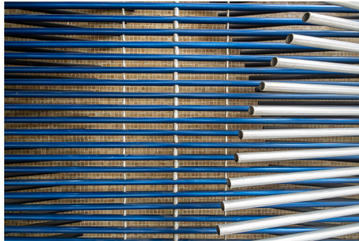
AUTOR IMAGEN: JULIOTAVOLO. © FUNDACIÓN GEGO / © JULIOTAVOLO